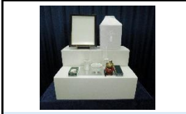
後飾り祭壇・仏具