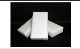
ドライアイス処置